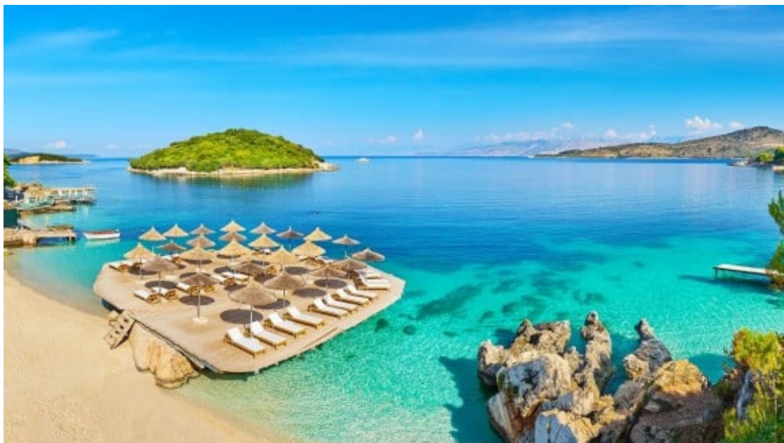
La riviera albanesa és, encara, un paradís desconegut.