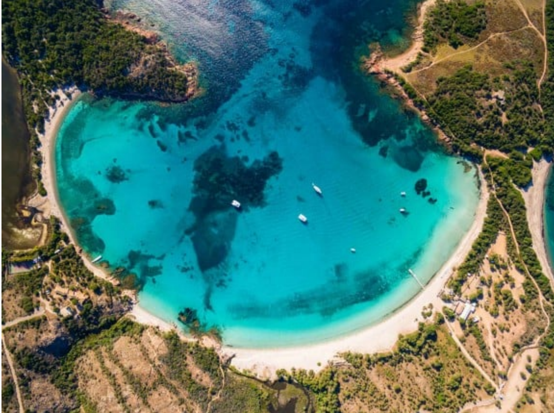
Platja de Rondinara.

La quarta illa més gran del Mediterrani sempre val la pena. Ubicada en l'angle entre la Toscana i la Costa Blava, Còrsega és una meravella geològica, com si es tractés d'una muntanya al mig del mar amb grans zones boscoses.