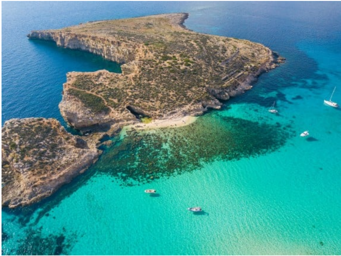
Blue Lagoon, a l'illa de Comino.