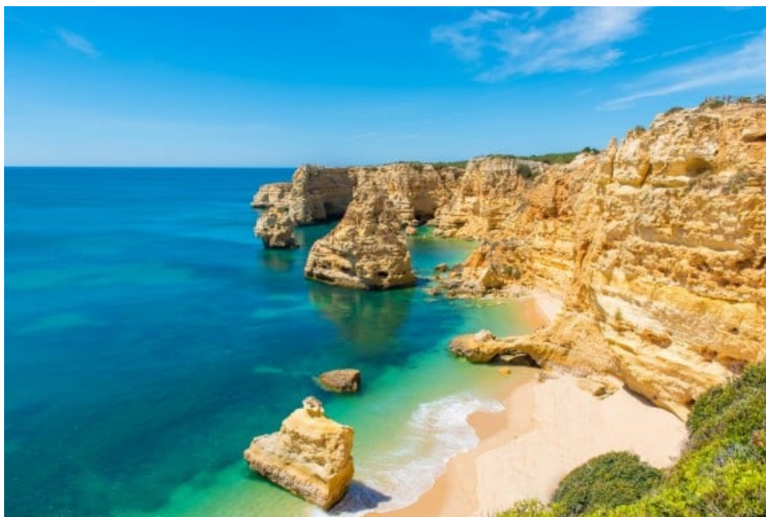
La Ponta da Piedade és un dels racons imprescindibles a l'Algarve.