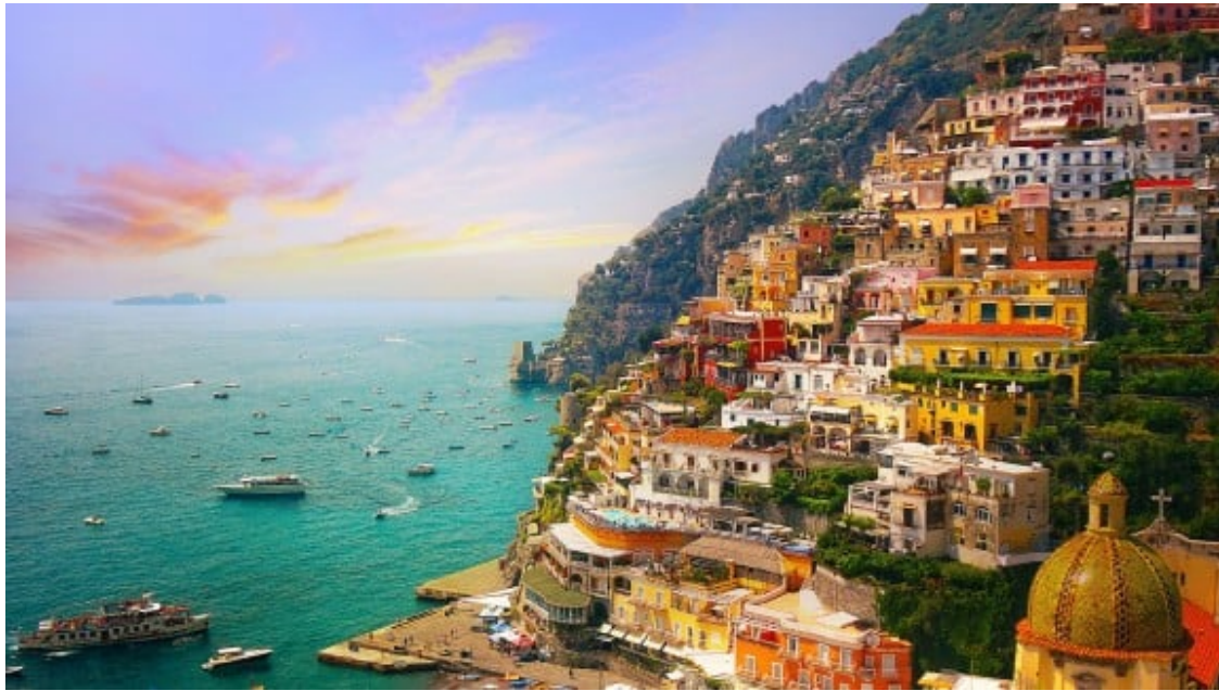
La Costa Amalfitana, una joia italiana.