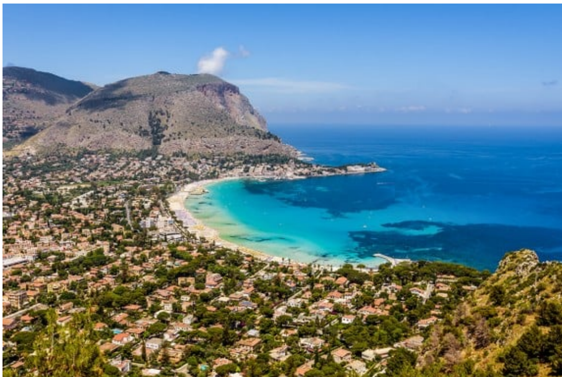
Platja de Mondello, a Palerm.

L'encant -i el menjar- del sud d'Itàlia en una illa amb platges paradisiàques. No fan falta més arguments per justificar un viatge a Sicília. Palerm és la capital d'una regió amb una enorme riquesa natural, amb volcans -Etna, Stromboli i Vulcano- illetes precioses -les Àgates-, llegat històric i grans reserves naturals com la de Zingaro.