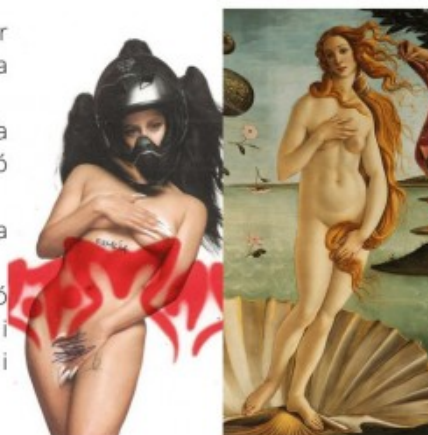
El naixement de Venus, de Botticelli