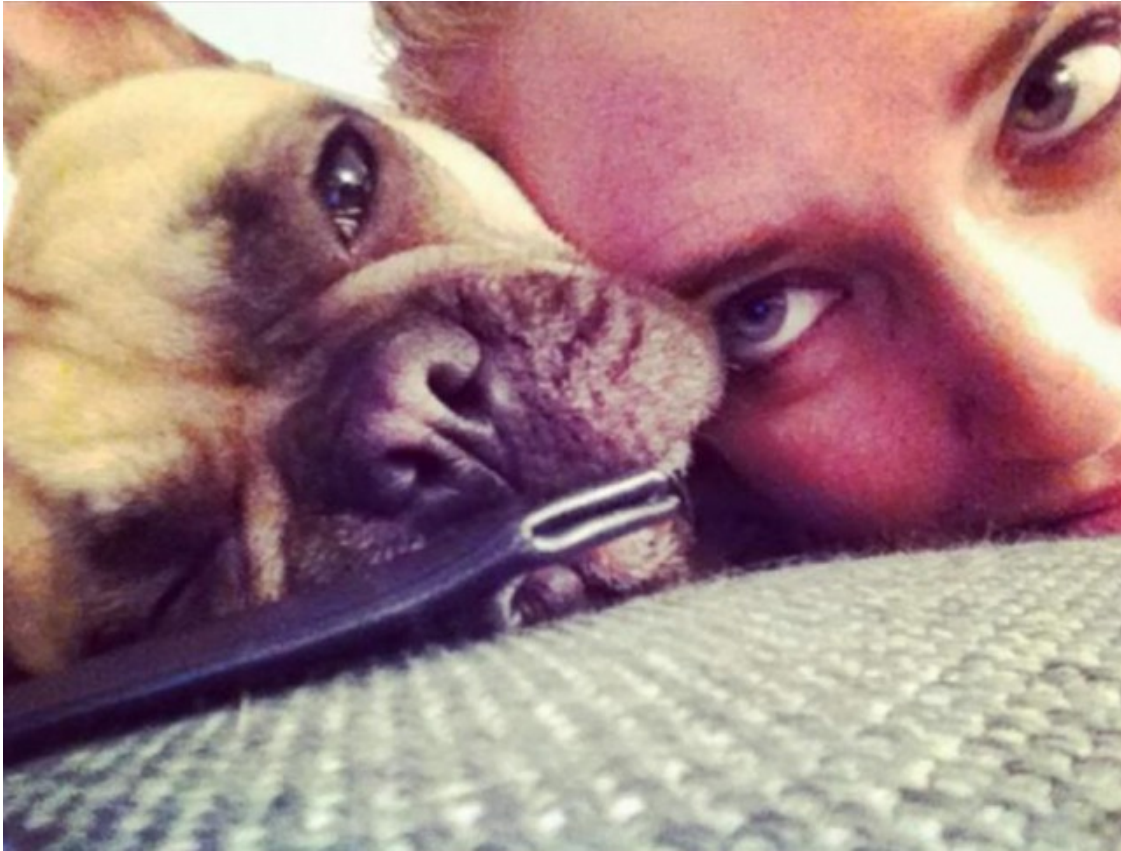
Beyoncé, 6 de novembre de 2012