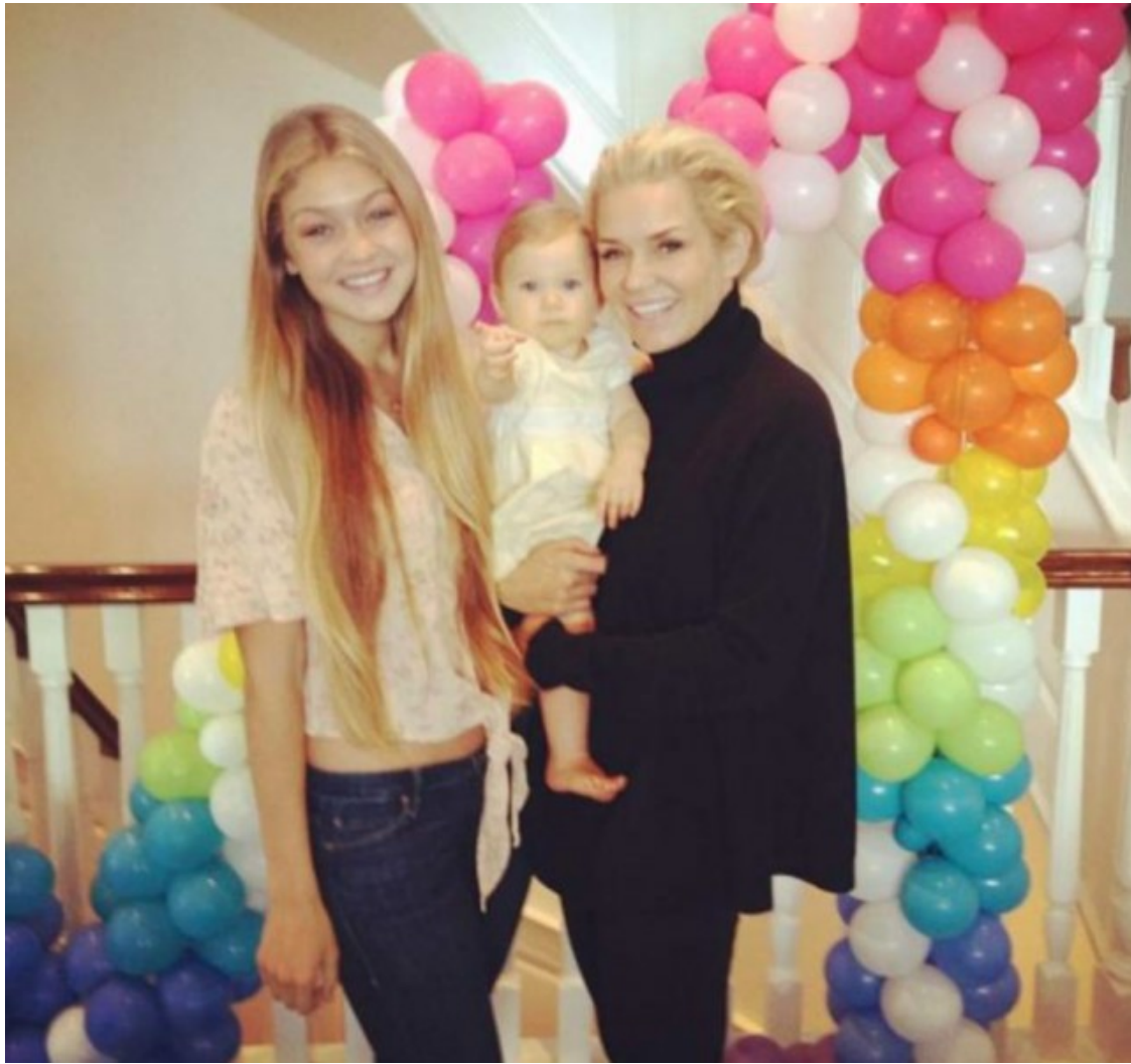
Kim Kardashian, 20 de febrer de 2012