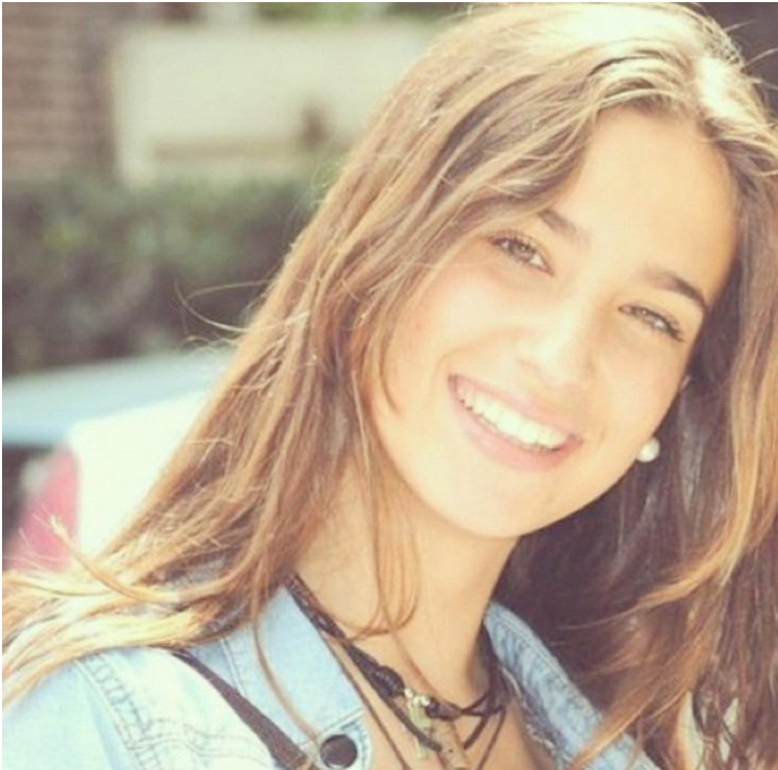
Chiara Ferragni, 16 de gener de 2012