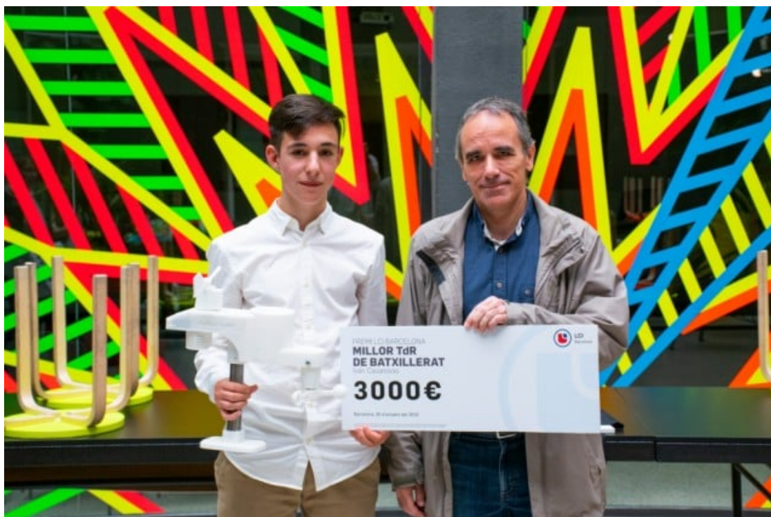
El guanyador de l'edició 2019.

Qui hi pot participar? Hi poden participar alumnes de centres públics, privats i concertats de Catalunya que estiguin cursant Batxillerat i realitzin un projecte relacionat amb el disseny, la innovació o la creativitat.