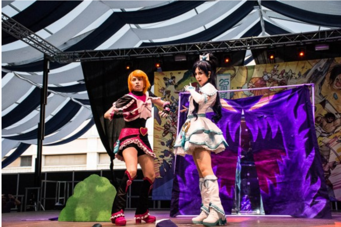
Dues persones fent cosplay durant el Saló del Manga

A l'escenari de la plaça de l'Univers s'han pogut veure concerts dels grups AKB48 i The 5,6,7,8's, concursos de 'cosplay' i diverses trobades de 'mangatubers'. A banda, l'organització de la fira ha celebrat la consolidació de la sala de projeccions, que ha acollit diverses estrenes cinematogràfiques. La pel·lícula 'One Piece: Estampida' ha rebut el Premi Auditori gràcies a les votacions del públic.