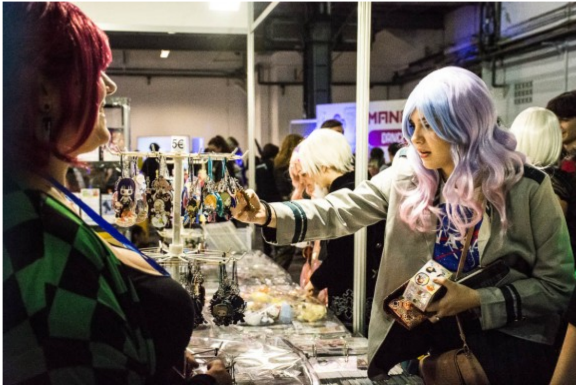
Una noia mirant les parades del Saló del Manga