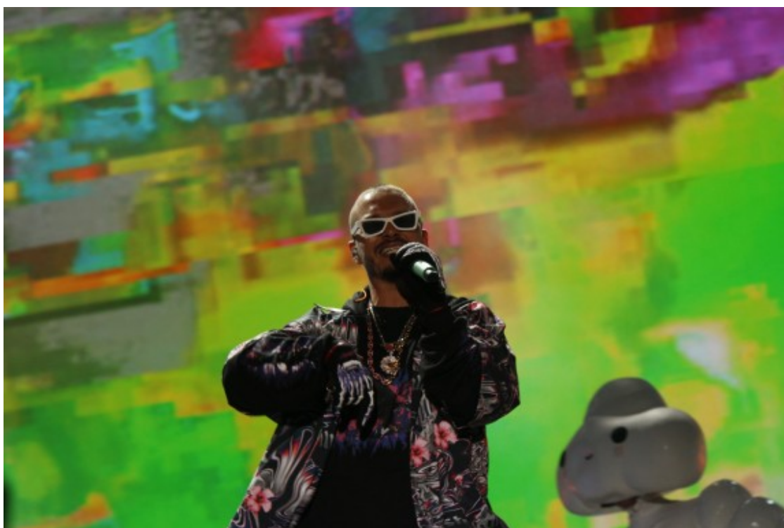
Una de les grans figures de reggaeton, el colombià J Balvin

L'irlandesa Róisín Murphy ha anat tancant l'edició d'enguany al Parc del Fòrum a dos quarts de tres de la matinada a l'escenari Primavera. Murphy ha celebrat amb força la seva tornada als escenaris interpretant temes d'àlbums com Hairless Toys (Clams & Clogs, 2015) i Take her up to Monto (RMS Studios, 2016). La seva electrònica pop va fer ballar al públic per acomiadar els concerts d'aquesta edició del Primavera Sound.