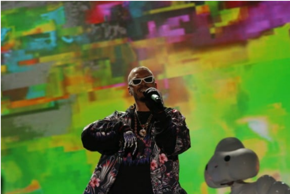
Una de les grans figures de reggaeton, el colombià J Balvin

L'irlandesa Róisín Murphy ha anat tancant l'edició d'enguany al Parc del Fòrum a dos quarts de tres de la matinada a l'escenari Primavera. Murphy ha celebrat amb força la seva tornada als escenaris interpretant temes d'àlbums com Hairless Toys (Clams & Clogs, 2015) i Take her up to Monto (RMS Studios, 2016). La seva electrònica pop va fer ballar al públic per acomiadar els concerts d'aquesta edició del Primavera Sound.