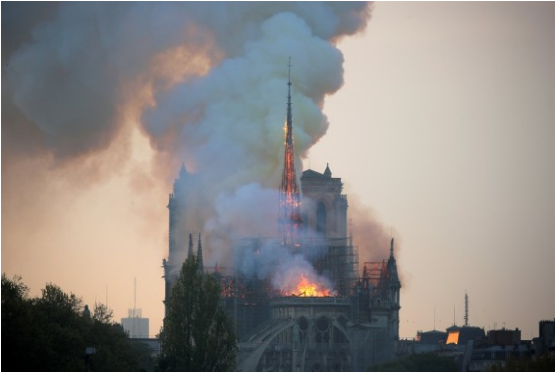
La catedral de Notre-Dame de París en flamas