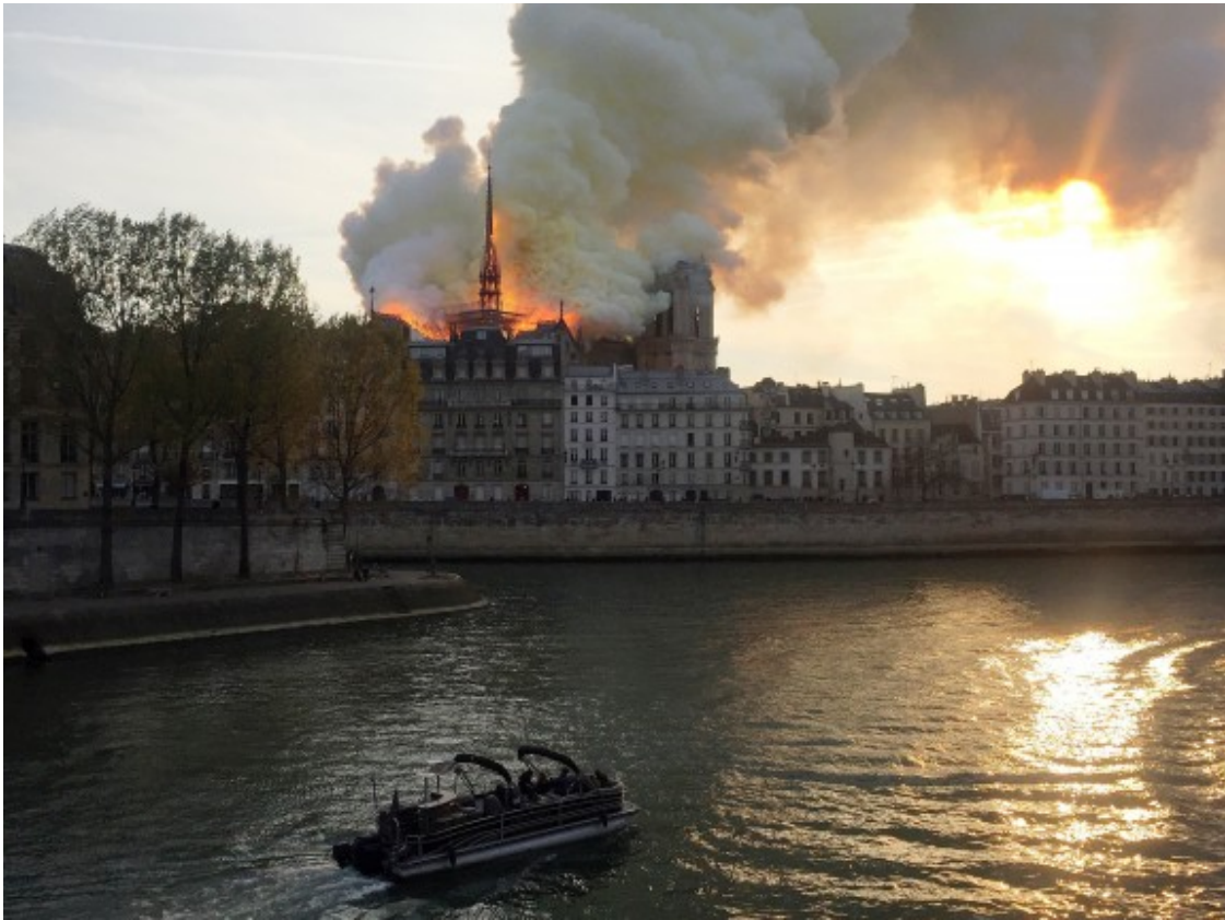
Notre-Dame, devastada