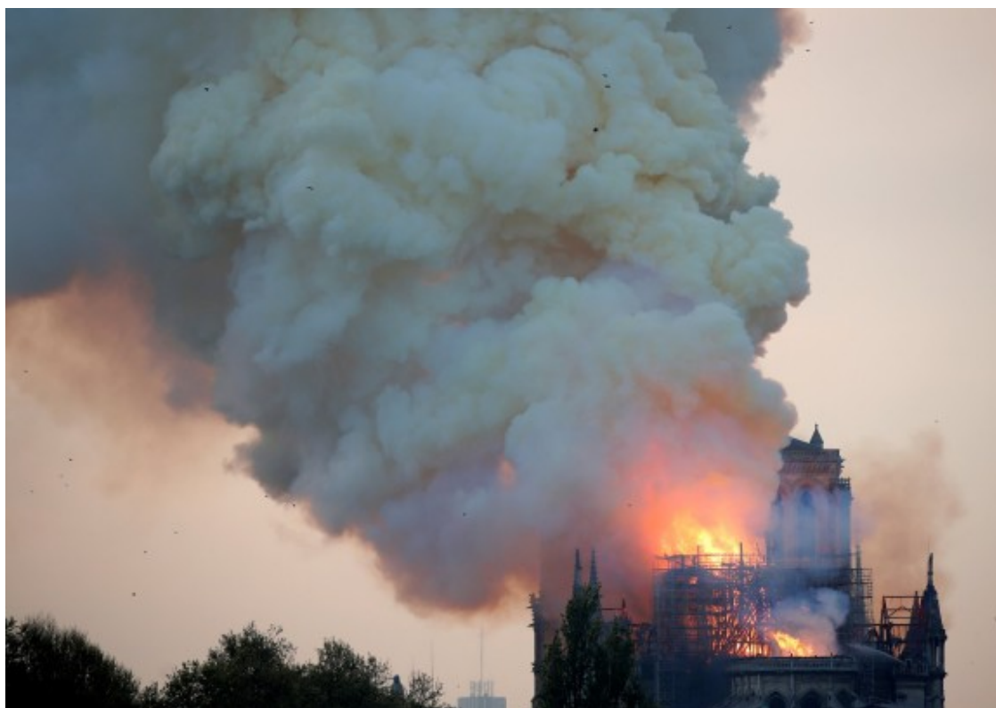
La catedral de Notre-Dame en flames, ja sense l'agulla